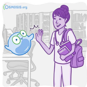
o experiență inedită de învățare