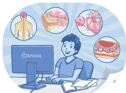
materiale video, instrumente interactive

Osmosis este o platformă digitală de educație medicală care conține materiale video, instrumente interactive și numeroase alte resurse care îi ajută atât pe studenți cât și pe clinicieni să se perfecționeze în tematica medicală complexă și să se pregatească pentru examene. Prin intermediul Osmosis, utilizatorilor li se oferă o experiență inedită de învățare, cu materiale video captivante, întrebări practice, lășcard-uri, totul fiind bazat pe principii științifice demonstrate care îmbunătățesc înțelegerea și reținerea eficientă a informației.