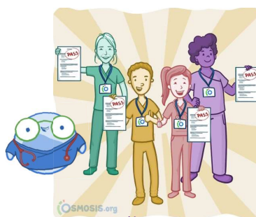
pregătire pentru examene

Crează un cont sau Conectează-te *folosind adresa instituțională